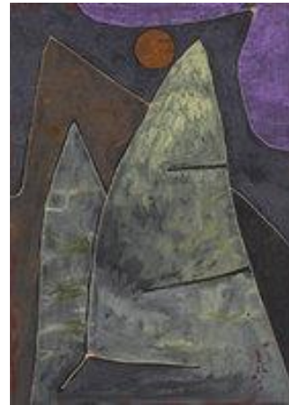
Paul Klee- Pleine lune dans la montagne - 1939