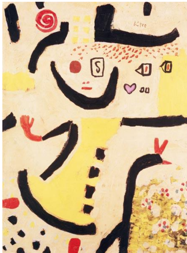
Ein Kinderspiel (un jeu d'enfant) 1939