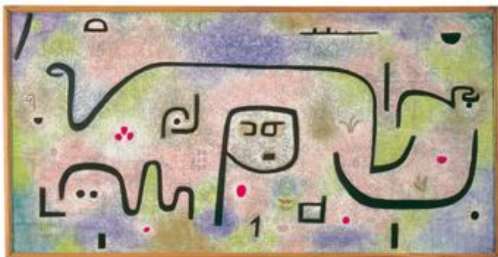
Insula dulcamara 1938

En effet, si l'on excepte l'année 1936, où en raison de ses souffrances, la production baisse nettement (seulement 25 œuvres), on peut dire que de 1937 à 1940, Klee est, en dépit de la maladie, dont les premiers symptômes apparaissent en 1935, plus créatif que jamais. En 1937, il réalise 264 œuvres, en 1938 pas moins de 489, l'une d'entre elles est «Insula dulcamara».