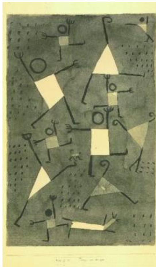
Tänze vor Angst 1938 Dances d'angoisse

En juillet 1937 , l'exposition « Entartete Kunst », « Art dégénéré », ouvre ses portes à Munich. Une quinzaine d'œuvres de Klee y figurent. De 1937 à 1941, 102 œuvres seront petit à petit éliminées des musées allemands. Heureusement, les nazis avaient besoin de devises, elles ne seront pas détruites mais vendues à l'étranger. On les retrouve dans les collections américaines. Klee tente d'ignorer ces mauvaises nouvelles et se concentre de manière plus intensive encore sur son œuvre.