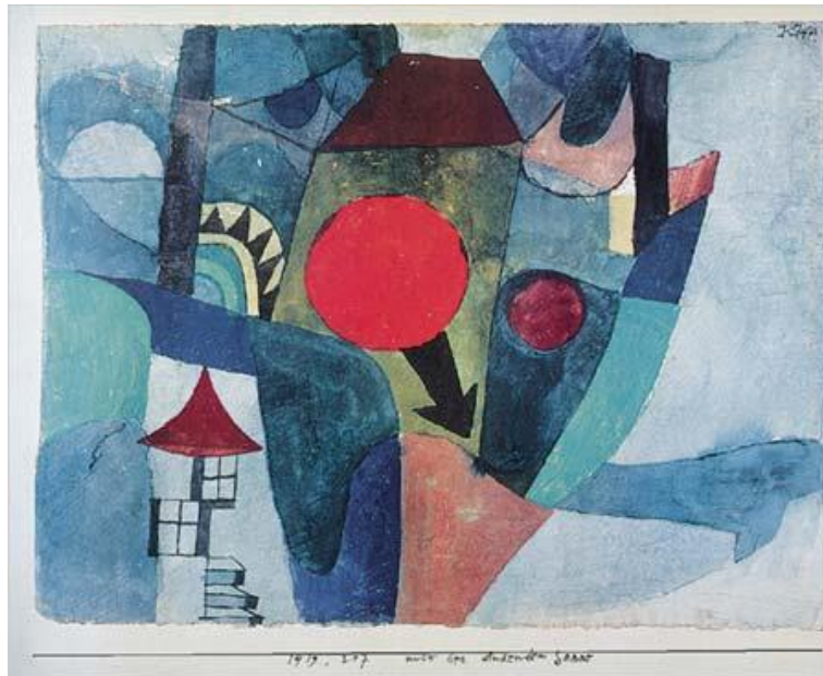
Landschaft mit sinkender Sonne (1919) (Paysage avec soleil couchant)

C'est dans la ville de Berne que Paul Klee (1879-1940) a passé près de la moitié de sa vie : il y a vécu jusqu' en 1901 et s'y est réfugié de 1933 à 1940. Il est né en Suisse de mère suisse et de père allemand. Il a la nationalité allemande comme son père. Le 24 avril 1939, Klee dépose une requête pour l'obtention de la nationalité suisse. Il décède le 29 juin 1940, une semaine avant la date de la délibération.