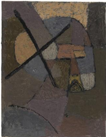
(von der Liste gestrichen - 1933- rayé de la liste)

1933 , les nazis s'emparent du pouvoir dans toute l'Allemagne. Il s'ensuit pour Klee, mi-mars, une fouille de sa maison à Dessau. Le 21 avril, Klee est mis en congé illimité de son emploi de professeur à l'Académie de Düsseldorf. Après avoir été traité de «juif galicien» et de «bolchevique de la culture», il est officiellement licencié le 1er janvier 1934 et destitué par les nazis de son poste de professeur à l'Académie des Beaux-Arts de Düsseldorf. Le 24 octobre, il émigre en Suisse. Cette émigration forcée constitua pour lui un des épisodes les plus douloureux de son existence.