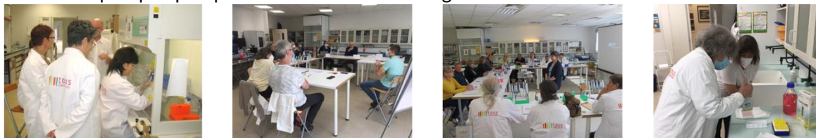
Illustration par quelques photos réalisées lors de stages :

Quelques retours de stagiaires (membres d'associations de malades et directement concernés par une maladie chronique) :